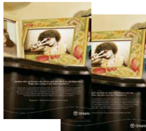
Affiche Lindsay – Drogues injectables Affiche à double face bilingue (11 x 13) 7610-4444345