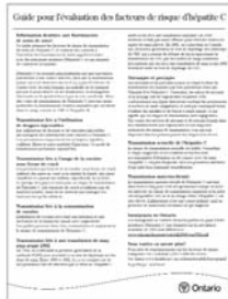
Guide pour l'évaluation des facteurs de risque d'hépatite C Fiche à double face bilingue (8,5 x 11) 7610-4144416