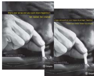
Affiche Partager la drogue Affiche à double face bilingue (11 x 13) 7610-4444387