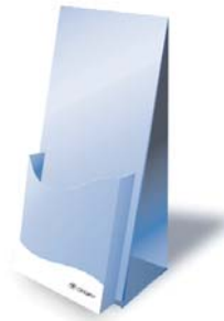
Porte brochures 7610-4550481