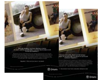
Affiche Brad – Tatouage Affiche à double face bilingue (11 x 13) 7610-4444353