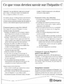
Fiche signalétique sur l'hépatite C : Ce que vous devriez savoir (8,5 x 11) 7610-2150100 (anglais) 7610-3150117 (français)